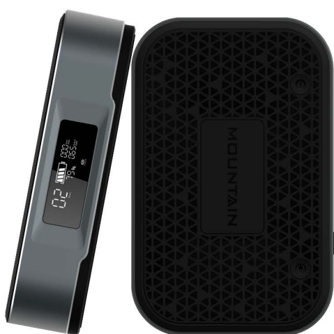
SAFE BANK 100